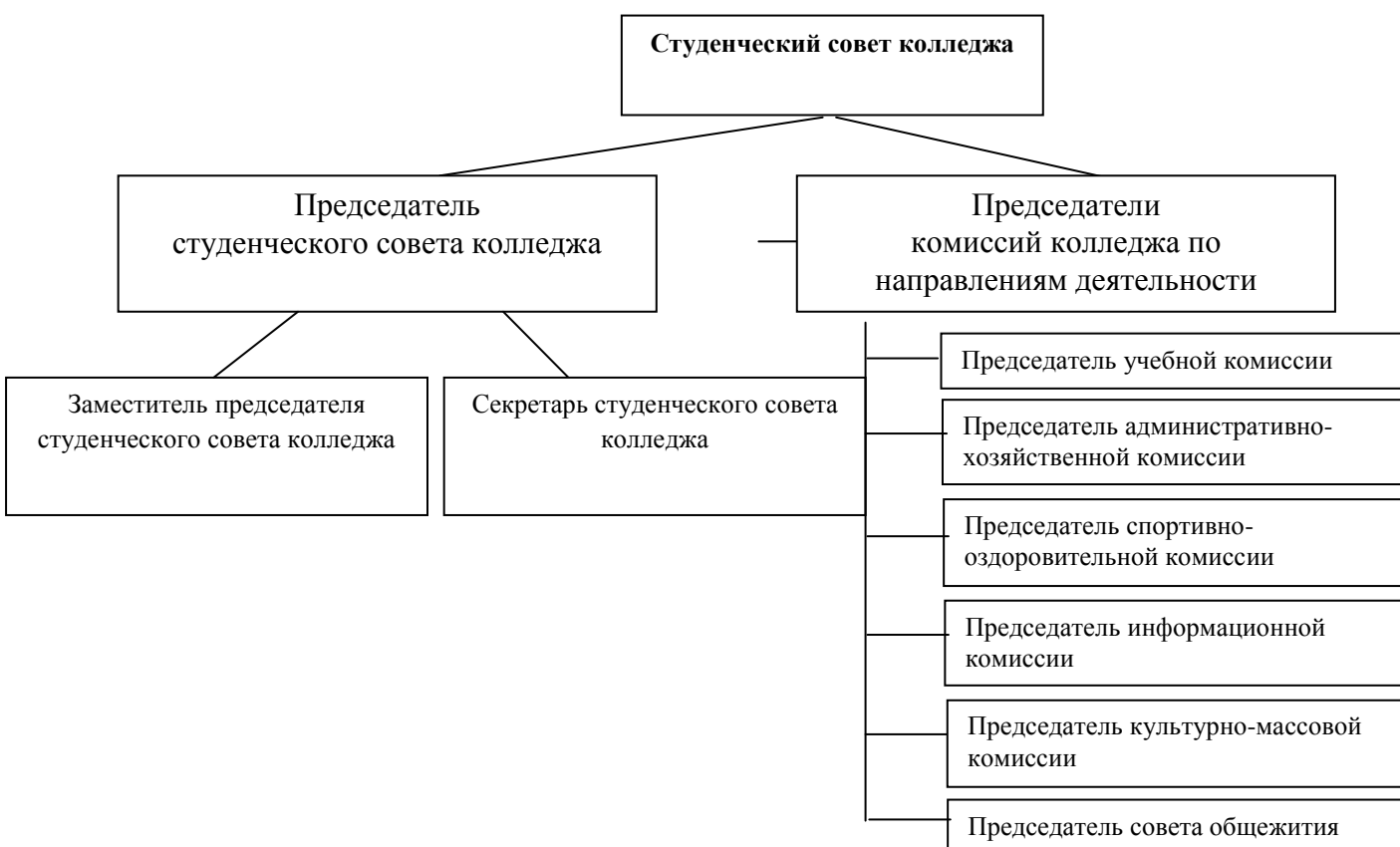
Схема студенческого совета колледжа